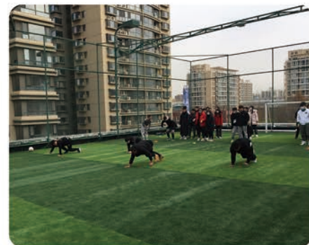
学生体验企业课程