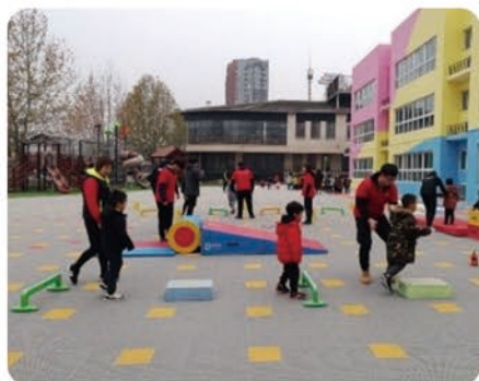
学生在实训场地授课