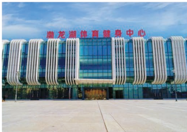
渤海湖体育健身中心