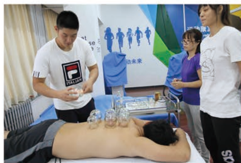
中医传统 治疗技术实操课