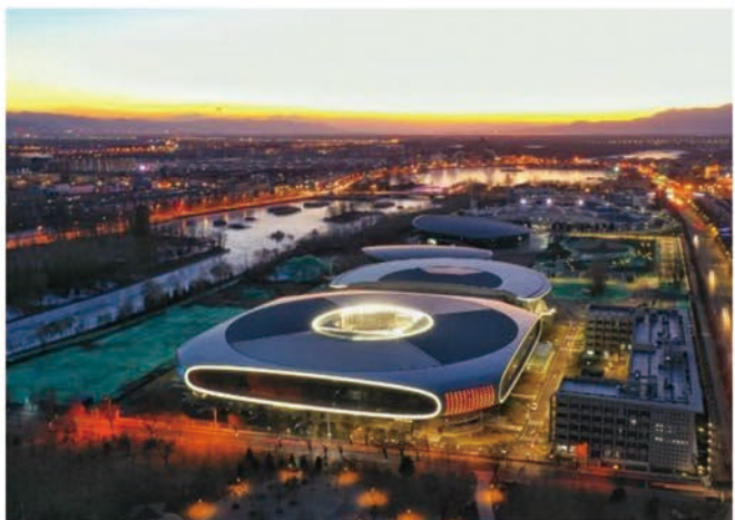
北京冰上项目训练基地