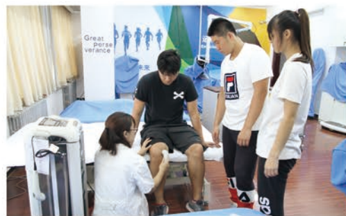
物理治疗 技术实操课