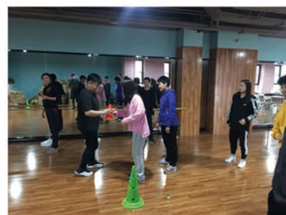
儿童青少年体育活动设计与组织课堂教学