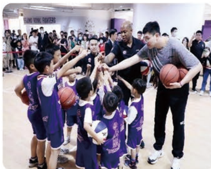
学生参与企业活动