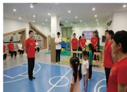
学生到企业完成理实一体课程学习

毕业生将依托于我院体育行业办学的资源优势，在儿童少年运动馆、篮球专项俱乐部、早教培训机构、幼儿园、儿童青少年运动赛事组织机构等相关企事业单位从事儿童青少年运动场馆运营管理、儿童青少年运动课程教练、课程培训导师、课程顾问、儿童青少年运动成长顾问、儿童青少年运动培训组织、儿童青少年运动赛事运营、儿童青少年运动市场营销、门店管理、体育网红达人内容创作等岗位工作。