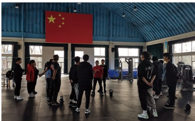
功能训练技术实操课