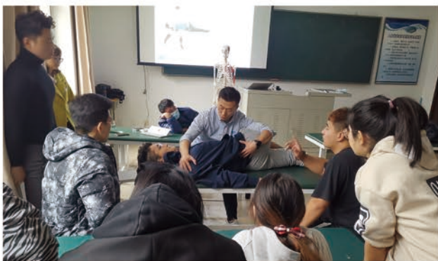
运动拉伸技术实操课

运动生理及功能解剖、运动防护及包扎、康复基础评估与功能性测试、康复治疗与训练、体能训练理论与实操、中医传统治疗技术、运动营养咨询与指导课程等。