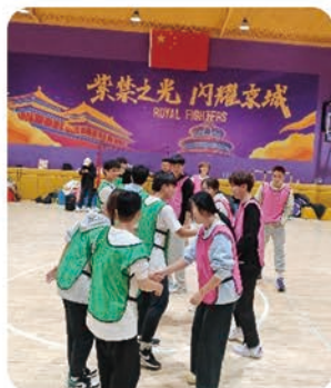
学生体验企业课程