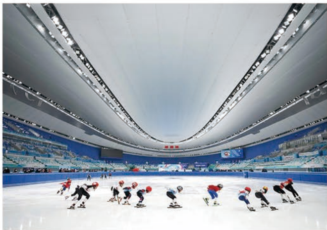
国家体育馆（冰丝带）

场馆运营管理实务、体育建筑、活动策划与管理、体育项目管理、体育场地设施管理维护、体育场馆消防与安全规范、体育市场营销、体育产业发展与创新、应急救援员证书、安全防护与急救、冰上运动场地设施设备运行与维护、体育场地照明系统运行与维护等。