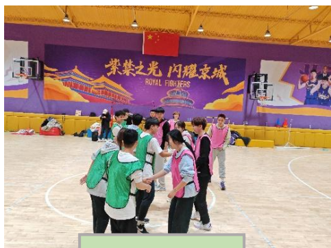
学生体验企业课程

组织机构等相关企事业单位从事儿童青少年运动场馆运营管理、儿童青少年运动课程教练、课程培训导师、课程顾问、儿童青少年运动成长顾问、儿童青少年运动培训组织、儿童青少年运动赛事运营、儿童青少年运动市场营销、门店管理、体育网红达人内容创作等岗位工作。