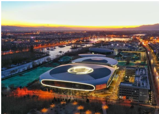
北京冰上项目训练基地