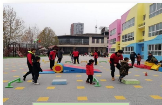
学生在实习实训场地授课