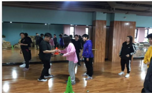
儿童青少年体育活动设计与组织课堂教学