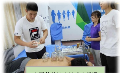
中医传统治疗技术实操课