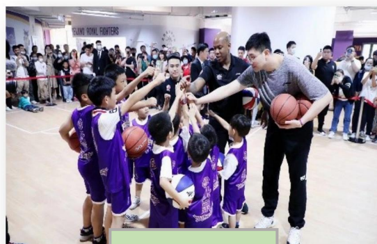
学生参与企业活动