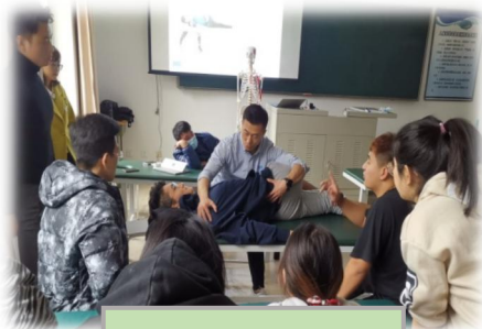
运动拉伸技术实操课

运动生理及功能解剖、运动防护及包扎、康复基础评估与功能性测试、康复治疗与训练、体能训练理论与实操、中医传统治疗技术、运动营养咨询与指导课程等。