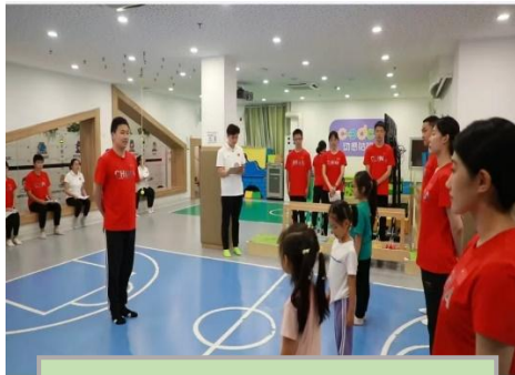
学生到企业完成理实一体课程学习

培养能够掌握运动解剖基础、儿童青少年生理与发育、体育教学教法等基础理论，具备良好幼儿体能训练、少儿专项训练、儿童青少年活动组织等专业技能，在体育、教育行业的幼儿体能训练师、少儿专项教练、课外体育指导员、幼儿体育教师、课程顾问等岗位（群），从事儿童运动体能训练、少儿体育项目教学、课外体育课程设计与实施、幼儿体育活动设计与实施、应急事件处理、课程咨询与指导等工作的高素质技术技能人才。