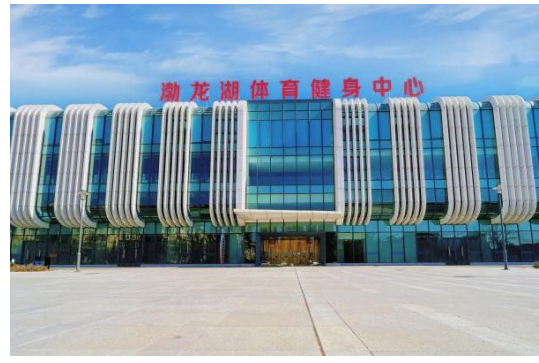
渤海湖体育健身中心