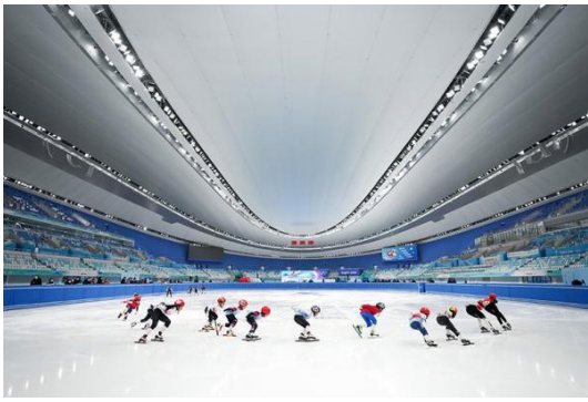
国家体育馆（冰丝带）