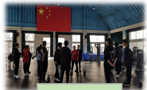
功能训练技术实操课