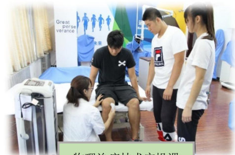
物理治疗技术实操课